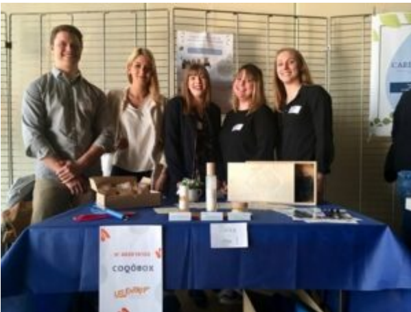
Coq ô Box