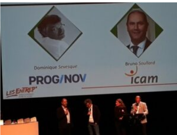
Cérémonie à La Fleuriaye

L'engagement de l'Icam pour l'entrepreneuriat s'est également